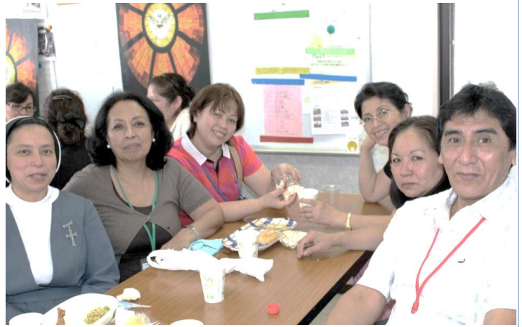
Fe. También contamos con la presencia del P. Claver.

Luego de la merienda vino el segundo debate en donde cada grupo sustentó el Objetivo escogido en el primero y esta vez, los 3 grupos coincidieron en el primer Objetivo APRENDER, VIVIR Y TRANSMITIR LA PALABRA DE DIOS.