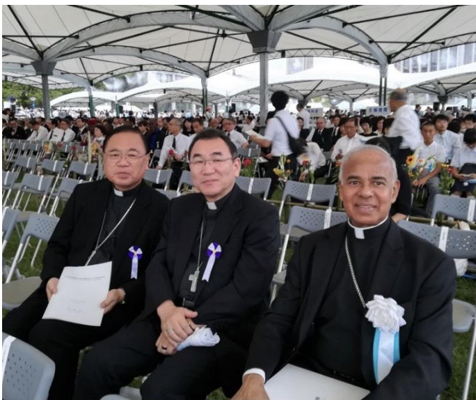
広島平和記念式典 2019 年