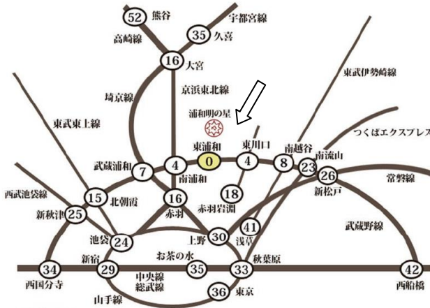
会場最寄り駅(JR 東浦和駅)までの所要時間